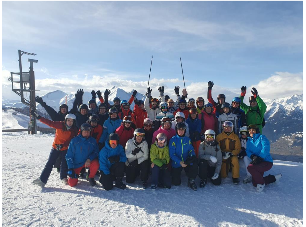
Der ganze Trupp, gut gelaunt und heiß auf den Skitag in Dorfgastein