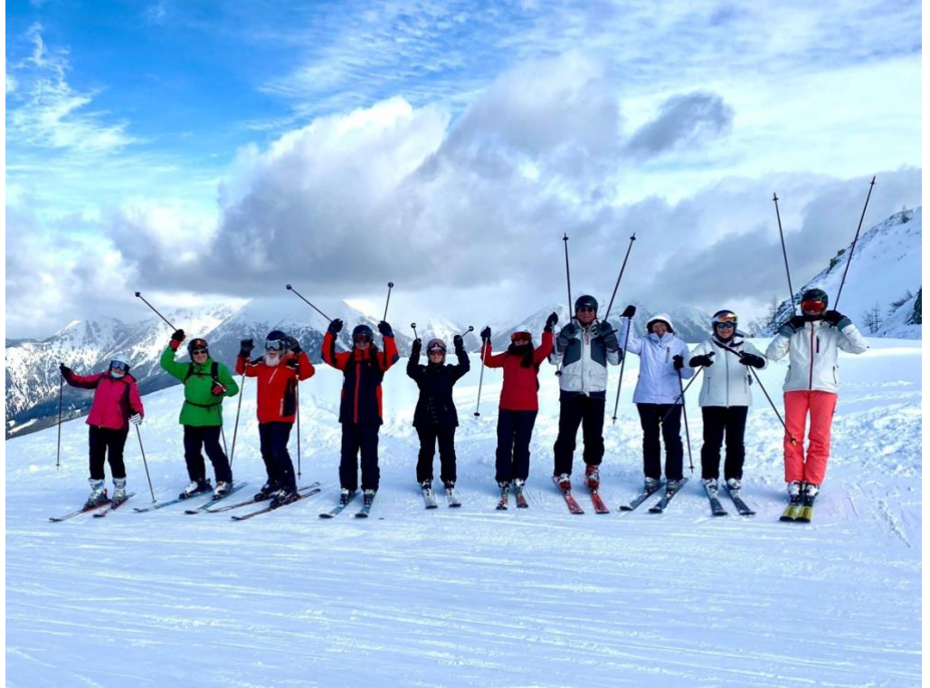
Alle haben Spaß bei tollem Wetter, was für ein schöner erster Skitag!